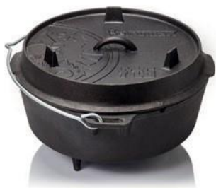
Dutch Oven ft1-ft9

Petromax nabízí více produktů vhodných pro vaše Atago