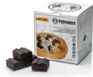
Petromax Cabix plus brikety