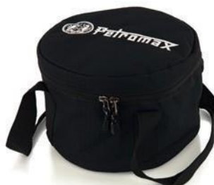
Převážní a skladovací taška