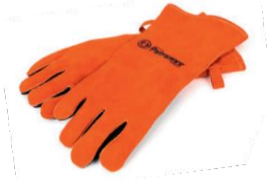
Rukavice Aramid Pro 300