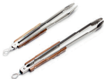
Kleště na grilování a na dřevěné uhlí